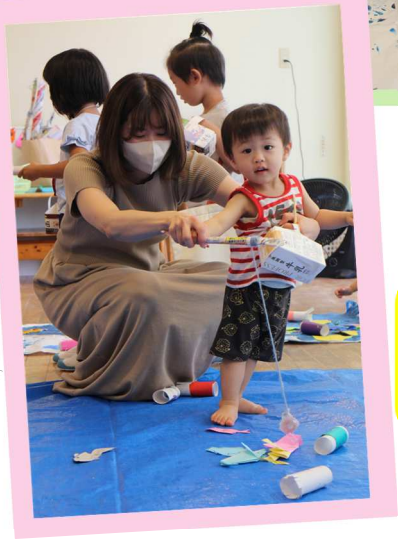
保育園の なつまつり👏