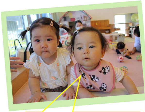
つかまり立ちがじょうずになったよ👏 みんなの成長が嬉しいです♡